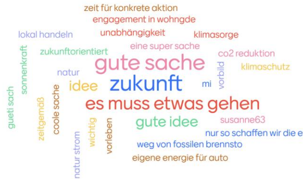
Abbildung 1 Frage 1: Was hat Sie motiviert Genossenschafter zu werden?

Sind Sie bereit, weitere Anteilscheine zu zeichnen, sobald eine erste rentable PV-Anlage in Betrieb genommen werden konnte und falls ja, wie viele?